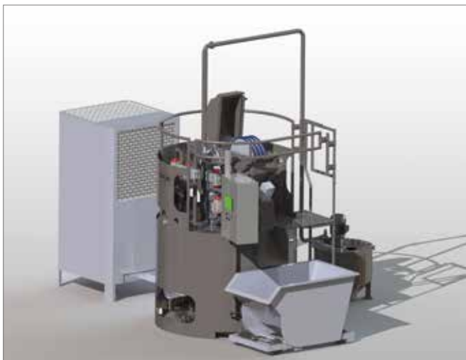
Beispiel für MF CS 1000-503 mit Kühlung und Hebestation Example of MF CS 1000- 503 with coolant chiller system and lifting pump

Optionen: Kühlung, Hebestation, prozessspezifische Filtergewebe Option: chiller, lifting station, process specific filtermeshes