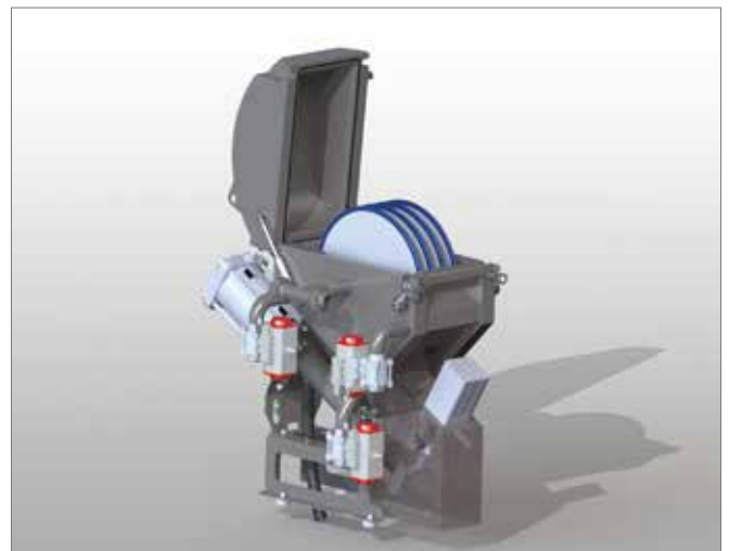
Beispiel für MF 503 Filterkopf Example of MF 503 Filterhead

Optionen: Kühlung, Hebestation, prozessspezifische Filtergewebe Option: chiller, lifting station, process specific filtermeshes